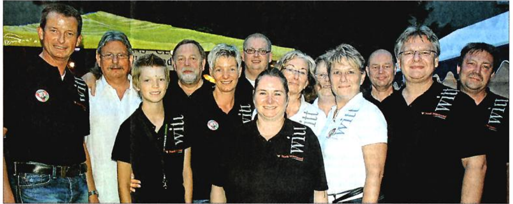
Die Shirts, die die Stadt Wittmund extra für den Bürgermarkt hatte anfertigen lassen, kamen an. Nicht nur die Besucher aus der Partnerstadt Barleben, auch viele Wittmunder trugen das Polohemd.