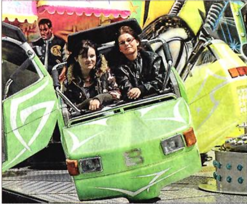
In den Fahrgeschäften war am Sonnabend Betrieb, gern ließen sich die Besucher einmal durchschütteln.