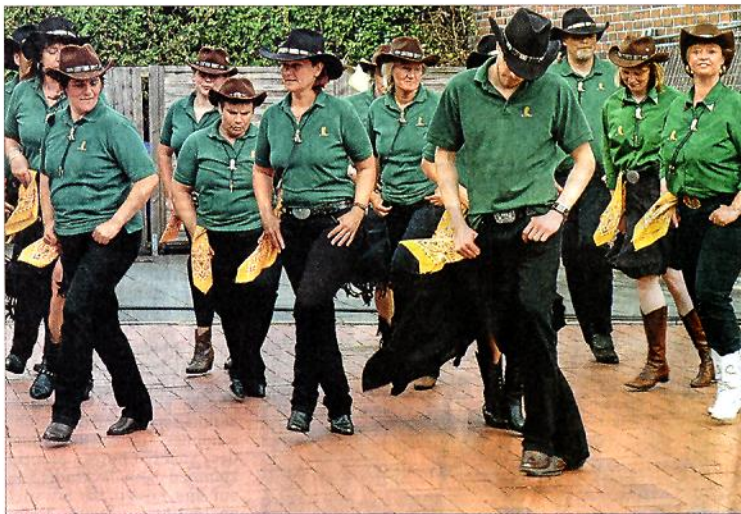
Die „Lightning Boots“ aus Wiesmoor begeisterten mit ihrem Line-Dance beim Reisebüro am Karl-Bosch-Platz die Zuschauer.

Schlägereien blieben nicht aus. Beim Florianszelt gerieten sich zwei 19-Jährige in die Haare. In der Brandenburger Straße schlugen sich zwei 17-Jährige. Mit einer Glasflasche ging ein Wittmunder in der Nacht zu Sonntag auf einen 21-Jährigen los, er erlitt eine Platzwunde am Kopf. In der Kirchstraße wurde von Freitag auf Sonnabend die Scheibe der Buchhandlung eingetreten. Hierfür sucht die Polizei Zeugen.